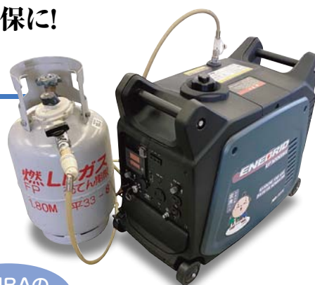
LPG発電機EP-3200はアドテック株式会社の製品です。