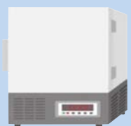
ワクチン保管 フリーザー